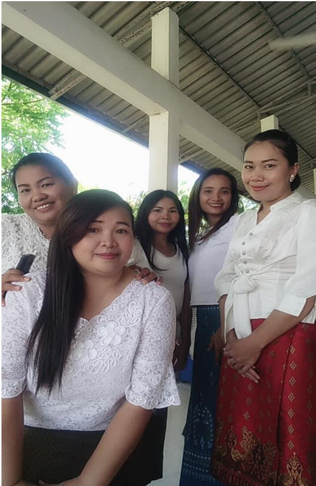
กิจกรรม องค์กรปกครองส่วนตำบลเมืองโดนกำหนดให้พนักงานแต่งกายผ้าไทยทุกวันศุกร์